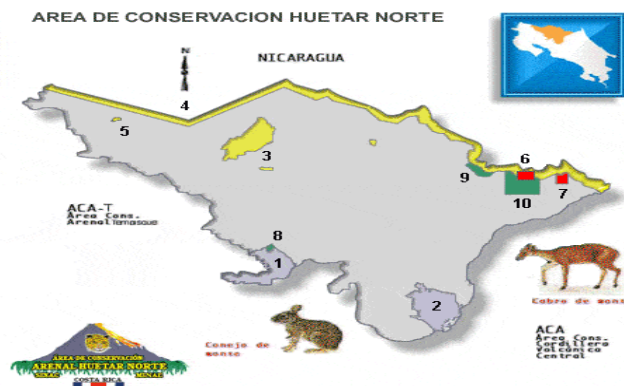
Figura 2: Distribución de áreas de conservación de la Región Huetar Norte.

A pesar de lo anterior se mantienen remanentes de bosques, zonas de amortiguamiento importantes para suplir de agua potable a muchas de las poblaciones de la región.