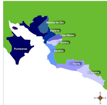
Figura 2, Cantones de la Región Pacífico Central

El SIR-PC se circunscribe a las necesidades de las pequeñas y medianas empresas en el Región Pacífico Central, la cual se delimita por los cantones de de: Aguirre, Parrita, Garabito, Esparza, Montes de Oro y Central de Puntarenas todos ellos de la provincia de Puntarenas. Adicionalmente, incluye los cantones de San Mateo y Orotina de la provincia de Alajuela.