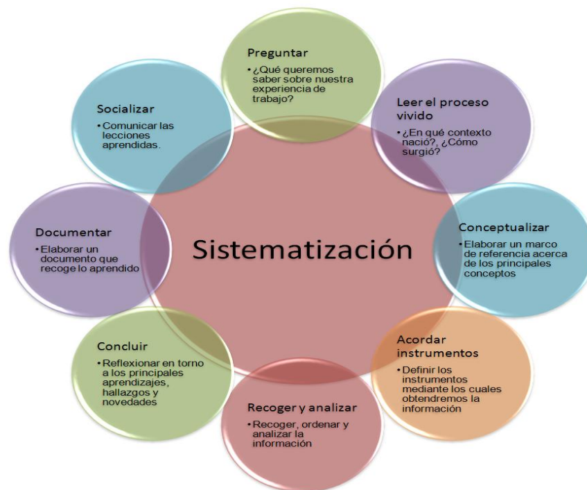
Figura 1-Metodología de la sistematización para el SIRPC

En síntesis, la sistematización de la experiencia pretende consolidar conocimiento útil del desarrollo del Sistema de Información. Los miembros del equipo de desarrollo tendrán en el proyecto un instrumento para la documentación, divulgación y transferencia de su experiencia. Y los demandantes tendrán una fuente de información útil y un instrumento de apoyo para el desarrollo de proyectos derivados del uso de dicha información.