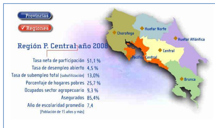
Figura 1, Índices de la Región Pacífico Central

Cuenta con total de 3912.28 kilómetros cuadrados, que representa un 7.6% del territorio nacional, limita al norte con las regiones Chorotega y Huetar Norte, al este con la Región Central y al suroeste con el Océano Pacífico y Región Brunca.