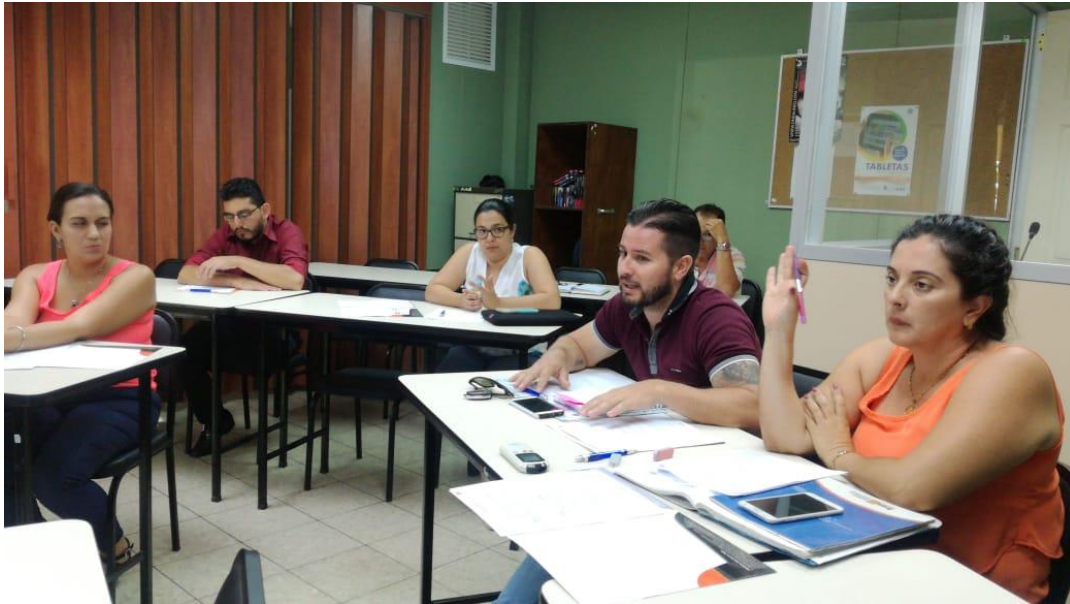
Grupo Focal con representantes de instituciones para definir los escenarios de trabajo (Municipalidad Jiménez, Municipalidad Turrialba, INDER, ADEL, INA, CATIE)