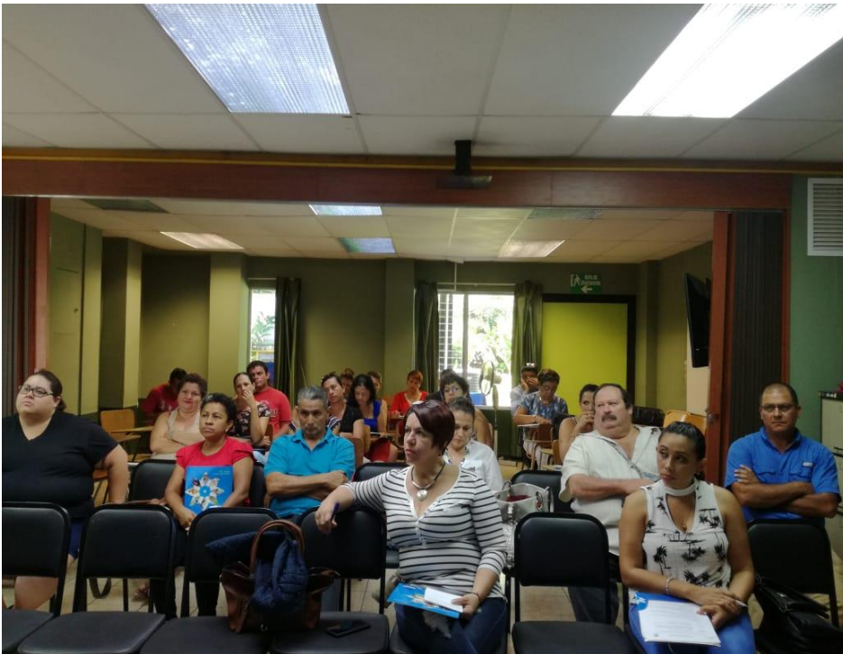
Grupo Focal con líderes comunales y asociaciones para definir los escenarios de trabajo