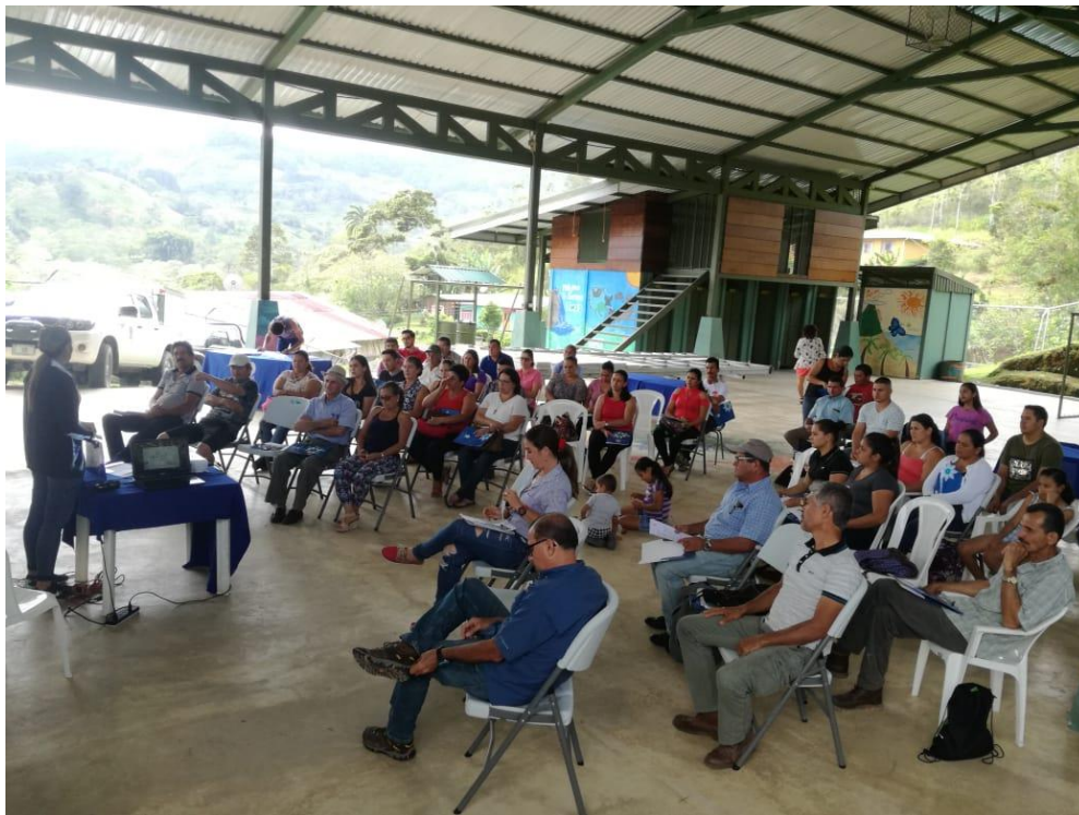
Sesión de información con comunidades