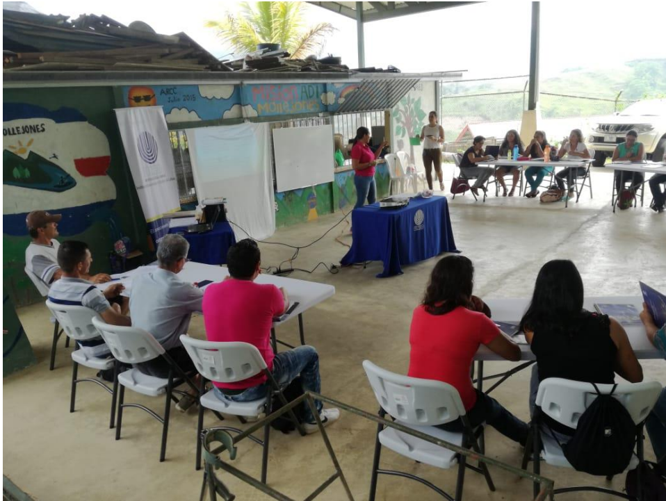
Sesiones de Trabajo