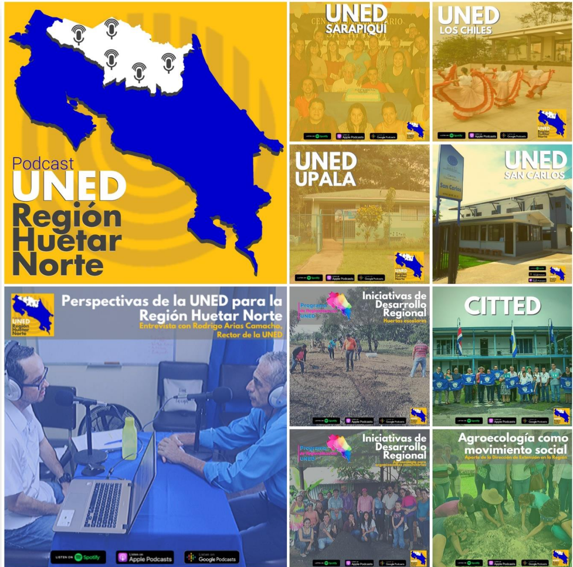
Ilustración 12: Portadas de los episodios del podcast.