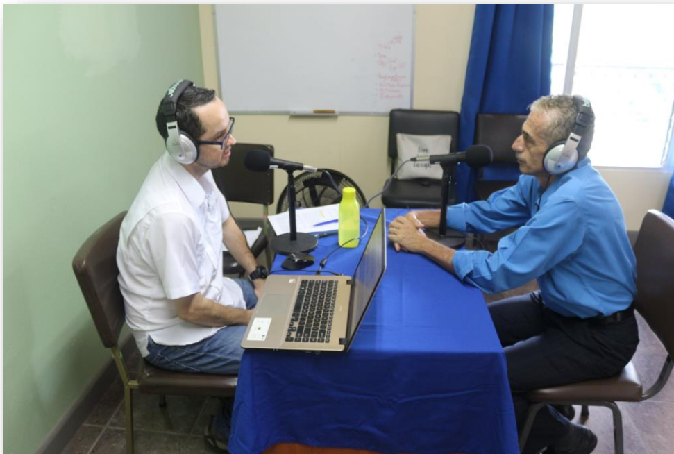
Ilustración 4: Entrevista con Rodrigo Arias Camacho, Rector UNED.