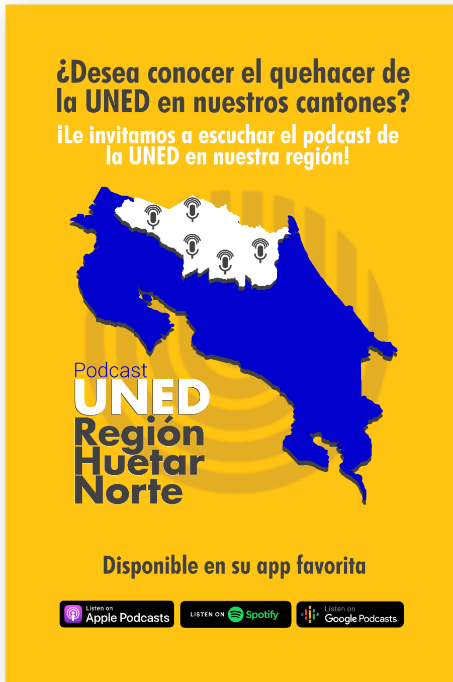
Ilustración 10: Afiche promocional distribuido por las sedes.