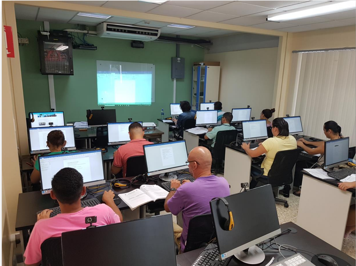
Imagen 1. Sesión de capacitación TIC