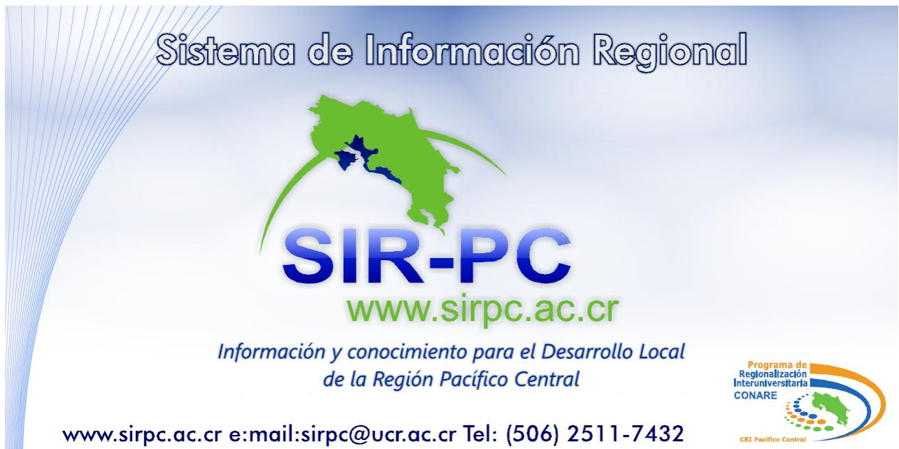
Figura 4: Muestra de valla publicitaria