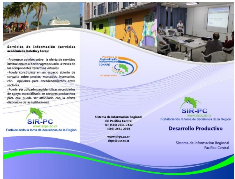
Figura 2: Muestra de brochures

Aunado a lo anterior y con el objeto de fortalecer la imagen del SIR-PC se trabajó en aspectos de diseño y ubicación de medios de divulgación promoción, posicionamiento y retroalimentación. La acción consistió en confeccionar vallas publicitarias, banners, afiches y brochures.