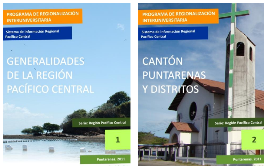
Figura 1: Muestra de los productos de información

Aunado a lo anterior, se desarrollaron dos temas concretos, uno de ellos aborda el concepto de competitividad territorial y el otro se trata de la identificación y análisis de actores del desarrollo local, los productos se obtuvieron a finales de diciembre por lo que resta incorporar la información al sitio web del SIR-PC.